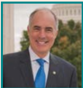
ROBERT P. CASEY, JR.

Desde que fue establecido en el 1961, el Comité Especial del Senado de los Estados Unidos para la Vejez (U.S. Senate Special Committee on Aging, en inglés) ha sido el centro de análisis y debate en el Senado sobre los asuntos relacionados a los adultos mayores en los Estados Unidos.